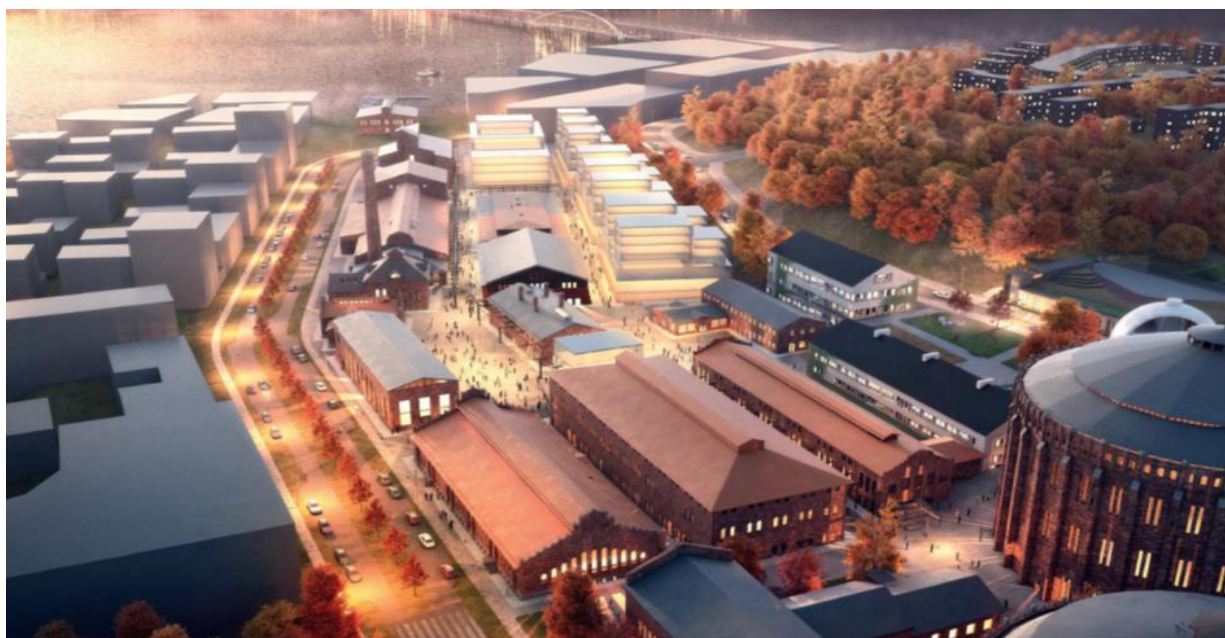
Visionsskiss Gasverket sett från väster.

CA Fastigheter AB har, genom dotterbolag, av JR Kvartersfastigheter förvärvat majoriteten av aktierna i ett bolag innehållande rättigheterna och markreservationerna till Gasverket i Norra Djurgårdsstaden Stockholm. Förvärvet är i vissa delar villkorat. Parterna skall härefter tillsammans utveckla projektet i samförstånd med Stockholm Stad.